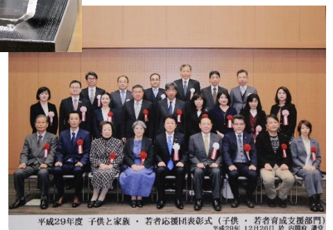
平成29年度 子供と家族・若者応援団表彰式 (子供・若者育成支援部門) 平成29年 12月26日 於 内閣府 講堂